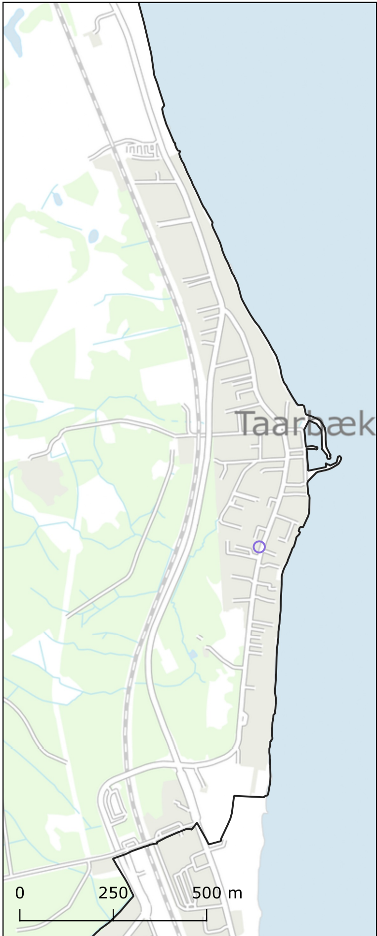
Oversigtskort over elladestandere i Lyngby-Taarbæk Kommune (per 22/04/2021)